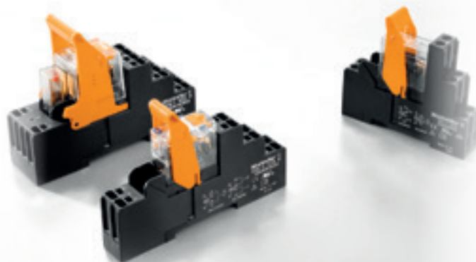
RIDERSERIES RCI Relais KITS 1CO (16A) und 2CO (8A)