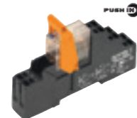
RIDERSERIES RCM Relais KITS 2 CO (12A)/ 3 CO (10A)/ 4CO (6A)