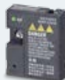
V20 Smart Access