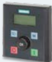
V20 BOP (Basis-Bedieneinheit)