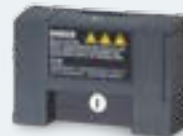
V20 Parameter Loader